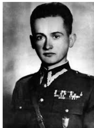
Mundur WP przedwojenny