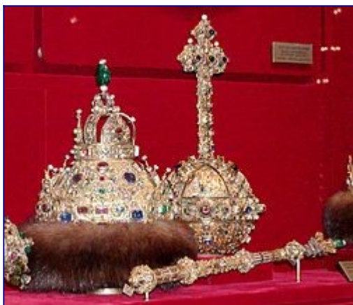
Insygnia władzy carów rosyjskich.

Po upadku Rzymu (476) i wielkiej schizmie (V-XIII wiek) chrześcijaństwo rozdzieliło się na dwa główne nurty – wschodnie i zachodnie. W oczach ówczesnych prawosławnych (chrześcijan wschodnich) chrześcijaństwo zachodnie (katolicyzm) było herezją. Głównym ośrodkiem greko nie samego prawosławia aż do XV wieku było Cesarstwo Bizantyńskie (Bizancjum). Podczas soboru florenckiego (na którym zasiadali także biskupi Wielkiego Księstwa Moskiewskiego) biskupi bizantyńscy podporządkowali się papieżowi i zgodzili się wejść pod jurysdykcję Rzymu w zamian za pomoc papieską w walce przeciw Turkom, podczas gdy większość biskupów ruskich odmówiła na soborze posłuszeństwa papieżowi. Po wojnie z Turcją i nie udzieleniu obiecanej pomocy przez papieża, Bizancjum w 1453 upadło.