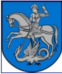
Herb Kamieńca Podolskiego