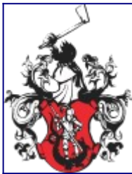
Herb Miasteczka Śląskiego