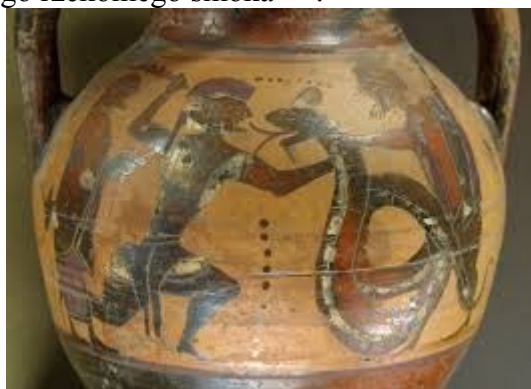
Apollo walczący z Pytonem malowidło na greckiej wazie

W literaturze chrześcijańskiej Lewiatan jest często wyobrażeniem Szatana, zagrażającym istotom stworzonym przez Boga i próbującym je pożreć. Podobnego zdania był św. Tomasz z Akwinu, który opisywał Lewiatana jako demona zazdrości. Lewiatan bywa łączony z motywem "piekielnej paszczy" ( Hellmouth ), potwornej istoty, w pysku której skazani na potępienie znikną podczas Sądu Ostatecznego.