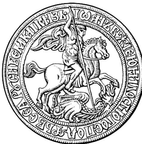
Obok Rzymianin jako Jerzy ze smokiem