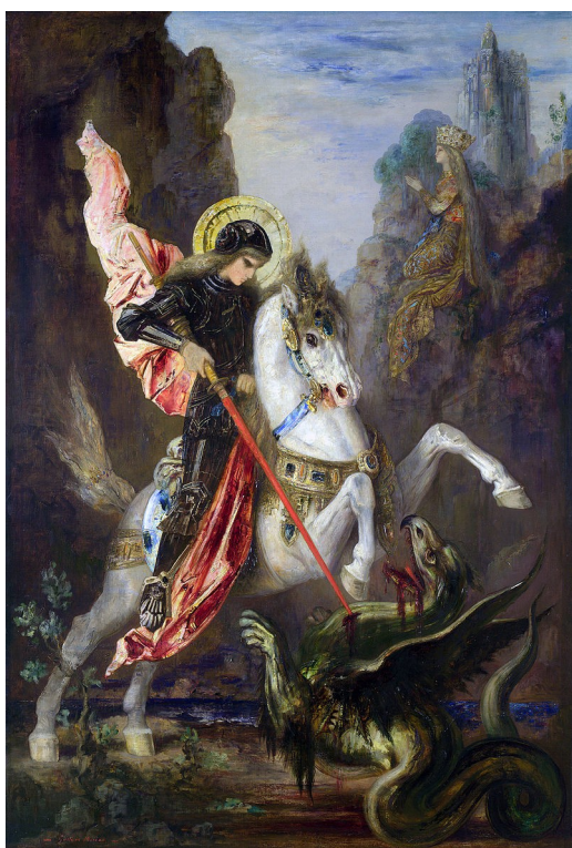
Święty Jerzy i smok pędzla Gustave'a Moreau

Atrybutami Jerzego są: anioł z wieńcem laurowym lub z koroną, baranek, biała chorągiew lub lanca z czerwonym krzyżem, koń, palma męczeństwa oraz m.in. przedmioty jego męki – gwoździe, kamień młyński i koło do łamania kości, miecz, smok u stóp, smok zabity. Postać Świętego Jerzego występuje w herbach wielu miejscowości, m.in. w herbie Dzierżoniowa, Milicza, Brzegu Dolnego i innych, przedstawiając świętego Jerzego zabijającego smoka (jako element w heraldyce).